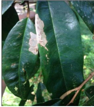
ภาพที่ 4 โรคใบจุด ( Phyllosticta sp.)