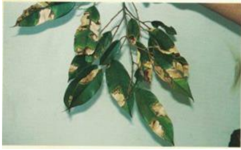
ภาพที่ 1 โรคใบจุด ( Colletotrichum sp.)