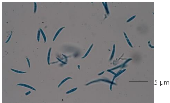
ภาพที่ 3 สปอร์เชื้อรา Colletotrichum sp. ภายใต้กล้องจุลทรรศน์กำลังขยาย 1000 เท่า

2.2 คัดแยกเชื้อร่าก่อโรคจากใบทุเรียนที่เป็นโรคใบจุด ใบทุเรียนจะมีเนื้อเยื่อตายบริเวณปลายใบ (ภาพที่ 4) มาแยกร่าก่อโรค เมื่อนำมาเลี้ยงบนอาหาร Dichloran 18% Glycerol Agar (DG18) พบว่าลักษณะเชื้อร่าเป็นละอองสีดำเจริญเต็มผิวหน้าอาหาร (ภาพที่ 5) เมื่อตรวจดูลักษณะสปอร์ภายใต้กล้องจุลทรรศน์ พบว่าสปอร์เป็นจุดกลมๆ เรียงติดกันเป็นกลุ่มก้อนจำแนกเป็นเชื้อร่า Phyllosticta sp. (ภาพที่ 6) สอดคล้องกับการศึกษาของ Chukeatirote et al. (2014) พบว่าเชื้อร่า Phyllosticta sp. จากการเลี้ยงในซูปมันสำปะหลัง และเพาะเลี้ยงในอุณหภูมิ 27 องศาเซลเซียส เป็นเวลา 2 สัปดาห์ โดย Phyllosticta sp. เป็นเชื้อที่ทำให้เกิดโรคใบจุดในทุเรียนและเชื่อนี้จะเข้าทำลายตั้งแต่ต้นและใบเริ่มจากจุดข้ำน้ำน้ำ สีเหลือง ต่อมาจะค่อยๆ ขยายใหญ่ขึ้น โดยมีลักษณะเป็นแผลจุดวงกลมรีเล็กๆ ขนาดเท่า