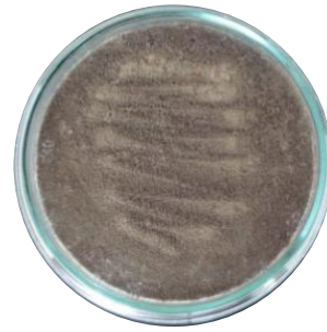
ภาพที่ 5 เชื้อรา Phyllosticta sp.