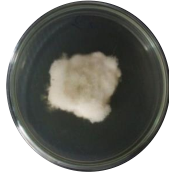
ภาพที่ 2 เชื้อรา Colletotrichum sp.