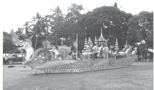
ภาพที่ 2 ได้รับการคัดเลือกให้ไปร่วมงานพุทธชยันตี จังหวัดพังงา