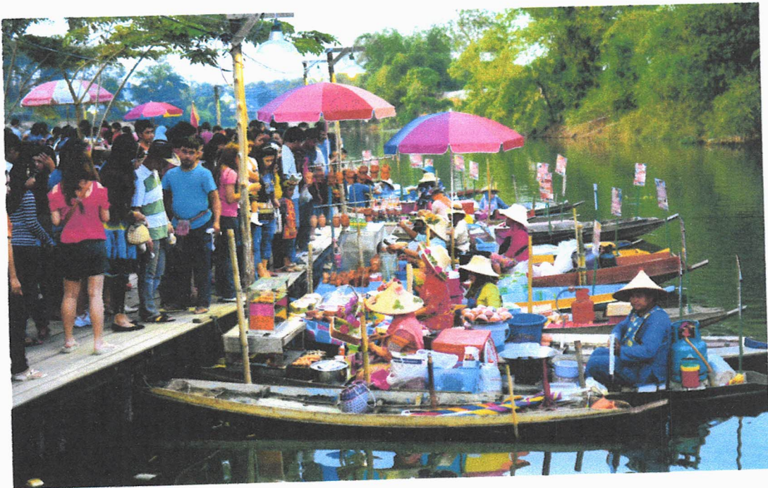
ภาพประกอบ 3 บรรยากาศการท่องเที่ยวตลาดน้ำคลองแห

นอกจากนักท่องเที่ยวจะได้เพลิดเพลินกับรายการอาหารพื้นบ้านที่หลากหลายและข้าวของเครื่องใช้ดั้งเดิมของชุมชนแล้ว ตลาดน้ำคลองแหยังมีเรือบริการนำเที่ยวชมทิวทัศน์ของสองฝั่งคลอง และยังสามารถเชื่อมโยงไปยังแหล่งท่องเที่ยวอื่นๆ อาทิเช่น ปากน้ำแหลมโพธิ์ จิตรกรรมฝาผนัง วัดคูเต่า และมัสยิดกลางจังหวัดสงขลา เป็นต้น