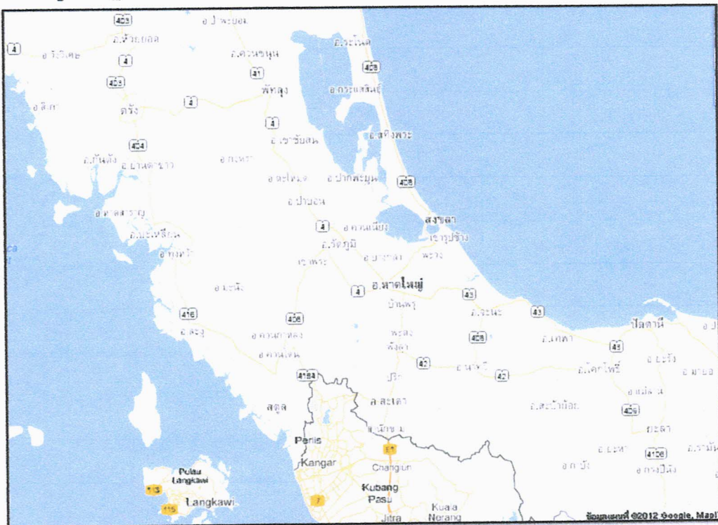
ภาพประกอบ 1 แผนที่จังหวัดสงขลา