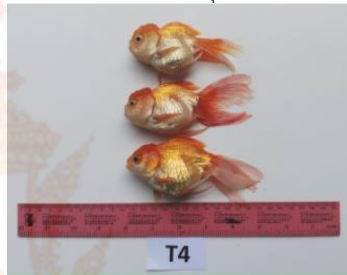
ภาพผนวกที่ 4 ปลาทองชุดการทดลองที่ 4