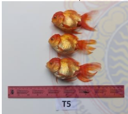
ภาพผนวกที่ 5 ปลาทองชุดการทดลองที่ 5