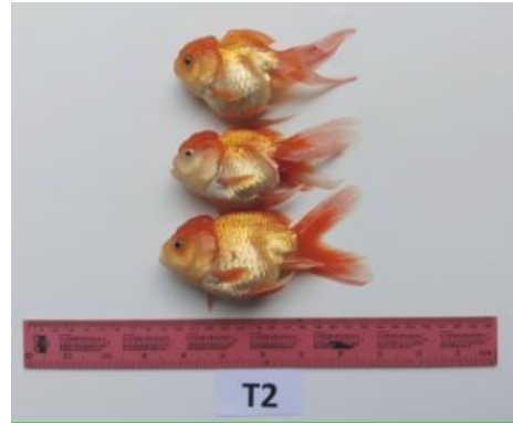
ภาพผนวกที่ 2 ปลาทองชุดการทดลองที่ 2