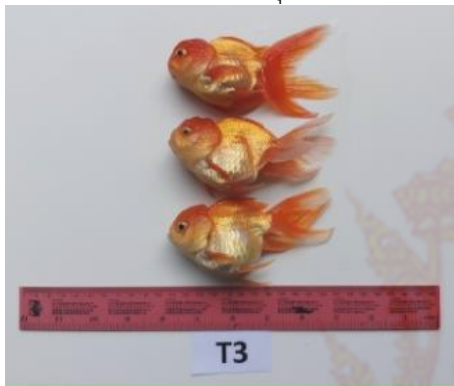
ภาพผนวกที่ 3 ปลาทองชุดการทดลองที่ 3