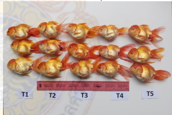
ภาพผนวกที่ 6 ปลาทองจากทุกชุดการทดลอง