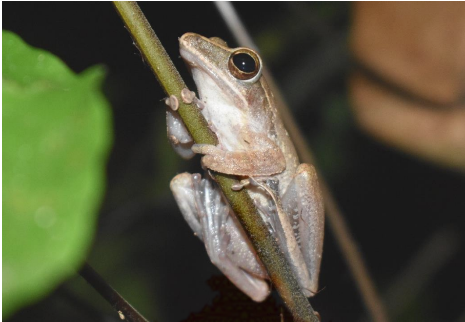
ภาพที่ 7 วงศ์ปาด ปาดบ้าน