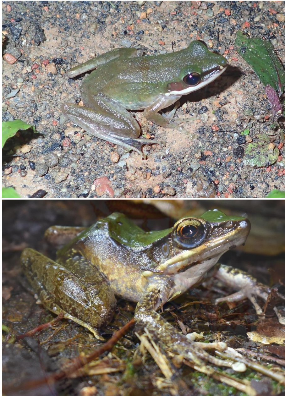
ภาพที่ 6 วงศ์กบ กบเขาล้างตอง (บน) กบชะง่อนผาตะนาวศรี (ล่าง)