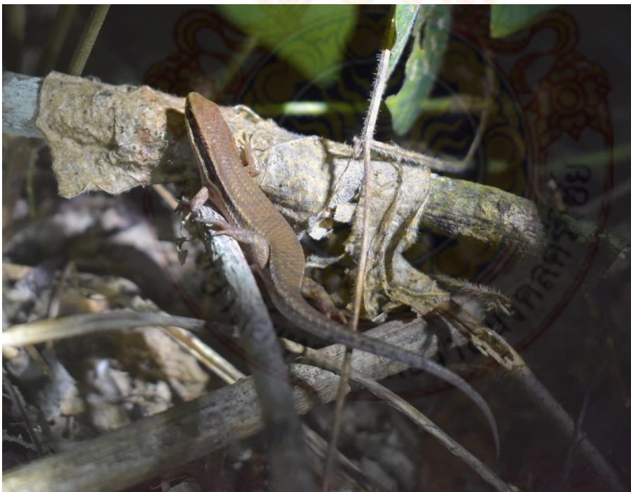
ภาพที่ 11 วงศ์จิ้งเหลน จิ้งเหลนบ้าน (บน) จิ้งเหลนหลากหลาย (ล่าง)