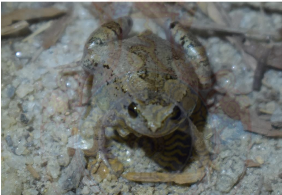
ภาพที่ 5 วงศ์อึ่ง อึ่งแม่หนาว (บน) อึ่งน้ำเต้า (ล่าง)