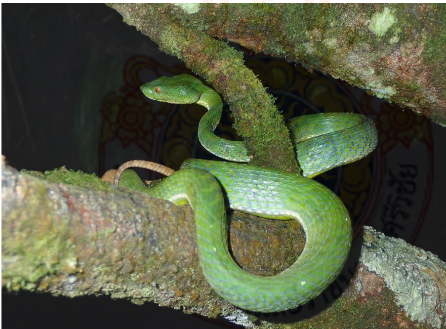
ภาพที่ 13 วงศ์งูแมวเซา งูเขียวหางไหม้ท้องเขียวได้