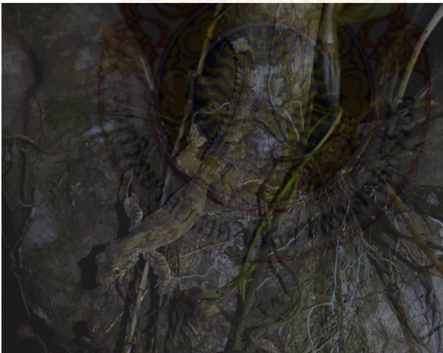
ภาพที่ 10 วงศ์ตุ๊กแก ตุ๊กกายหมอบุณยสัง (บน) ตุ๊กแกบินทางหยัก (ล่าง)