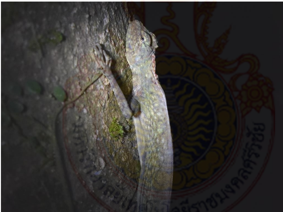
ภาพที่ 9 วงศ์กิ้งก่า กิ้งก่าเขานามสั้น (บน) กิ้งก่าบินคอแดง (ล่าง)