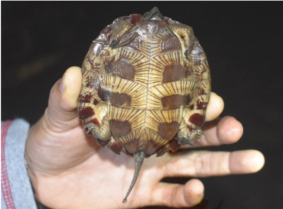
ภาพที่ 8 วงศ์เต่านา เต่าใบไม้ล้มลุก