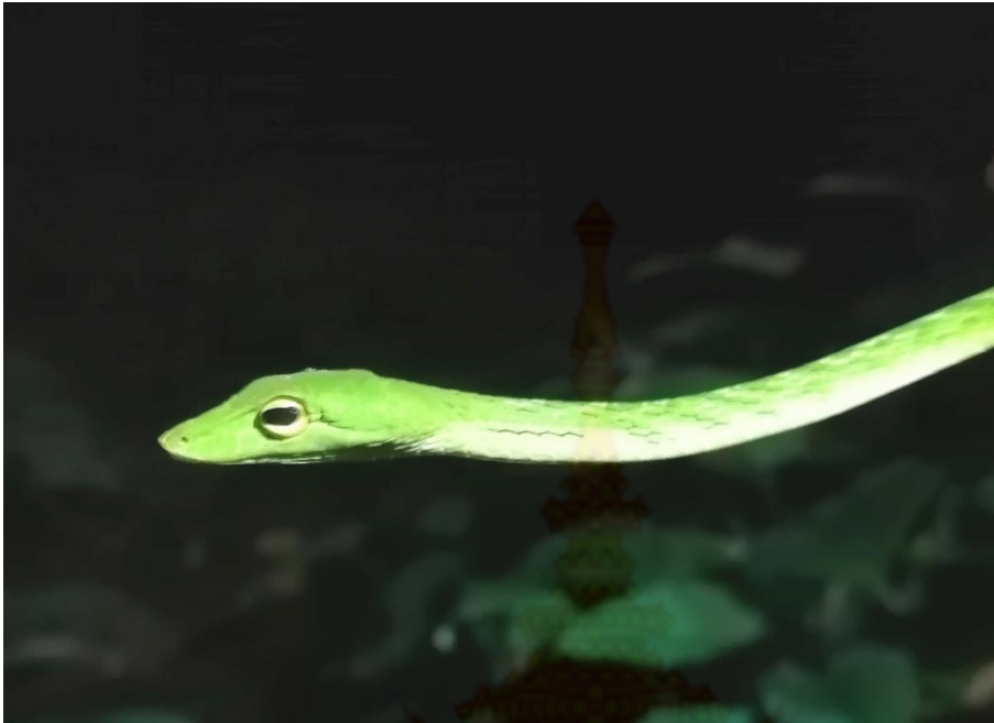
ภาพที่ 12 วงศ์งูพิษเขี้ยวหลัง งูเขียวหัวจิ้งจกมลายู