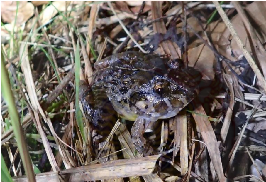
ภาพที่ 3 วงศ์กบทูต กบทูต (บน) กบหัวโต (ล่าง)