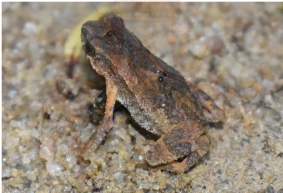
ภาพที่ 2 วงศ์คางคก จงโคร่ง (บน) คางคกแคระหัวจีบ (ล่าง)