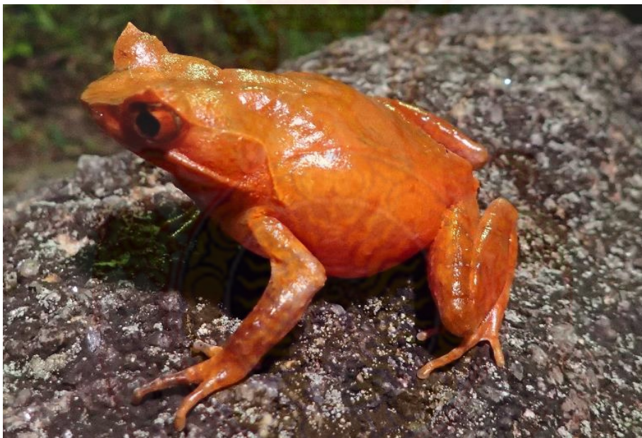
ภาพที่ 4 วงศ์อึ่งกราย อึ่งกรายลายเลอะ (บน) อึ่งกรายหัวมน (ล่าง)