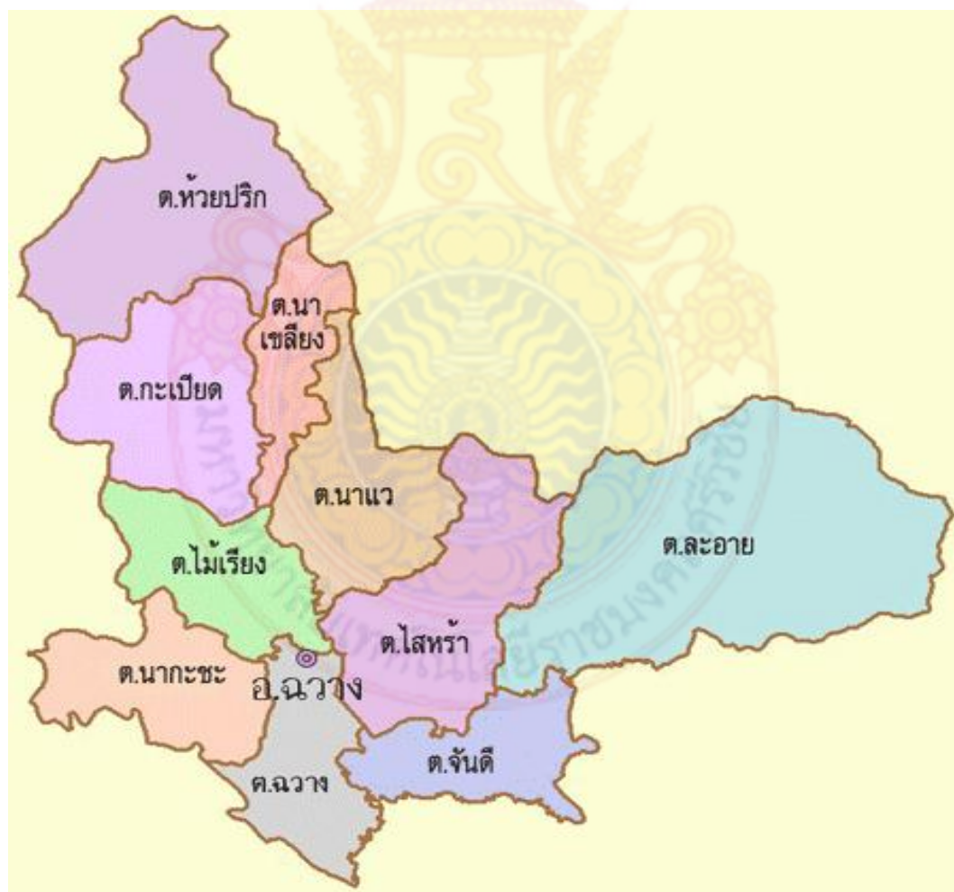
ภาพที่ 2.2 ที่ตั้งและอาณาเขต

อำเภอฉวางตั้งอยู่ทางทิศตะวันตกเฉียงเหนือของตัวจังหวัดนครศรีธรรมราช อยู่ห่างจากจังหวัดนครศรีธรรมราช 72 กิโลเมตร มีเนื้อที่ทั้งหมด 563.18 ตารางกิโลเมตร ประกอบด้วย 10 ตำบล (86 หมู่บ้าน) มีเทศบาลตำบล 4 แห่ง และองค์การบริหารส่วนตำบล 8 แห่ง มีอาณาเขต ดังนี้